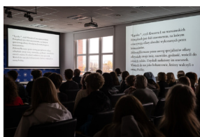
Inauguracja projektu „Łączka i inne miejsca poszukiwań” w Gdańsku - 30 października 2024. Fot.