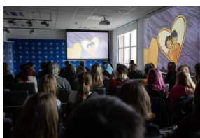
Inauguracja projektu „Łączka i inne miejsca poszukiwań” w Gdańsku - 30 października 2024.