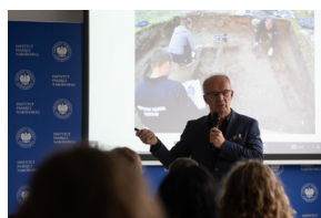
Inauguracja projektu „Łączka i inne miejsca poszukiwań” w Gdańsku - 30 października 2024.