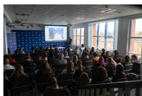
Inauguracja projektu „Łączka i inne miejsca poszukiwań” w Gdańsku - 30 października 2024.