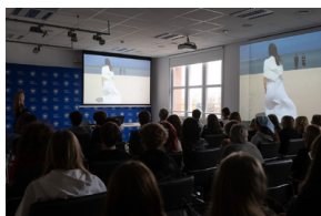
Inauguracja projektu „Łączka i inne miejsca poszukiwań” w Gdańsku – 30 października 2024.