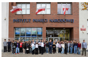
Inauguracja projektu „Łączka i inne miejsca poszukiwań” w Gdańsku – 30 października 2024.