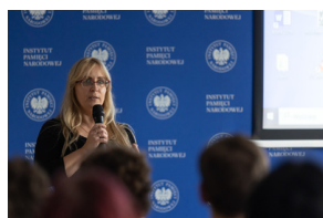
Inauguracja projektu „Łączka i inne miejsca poszukiwań” w Gdańsku - 30 października 2024.