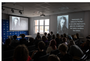
Inauguracja projektu „Łączka i inne miejsca poszukiwań” w Gdańsku – 30 października 2024.