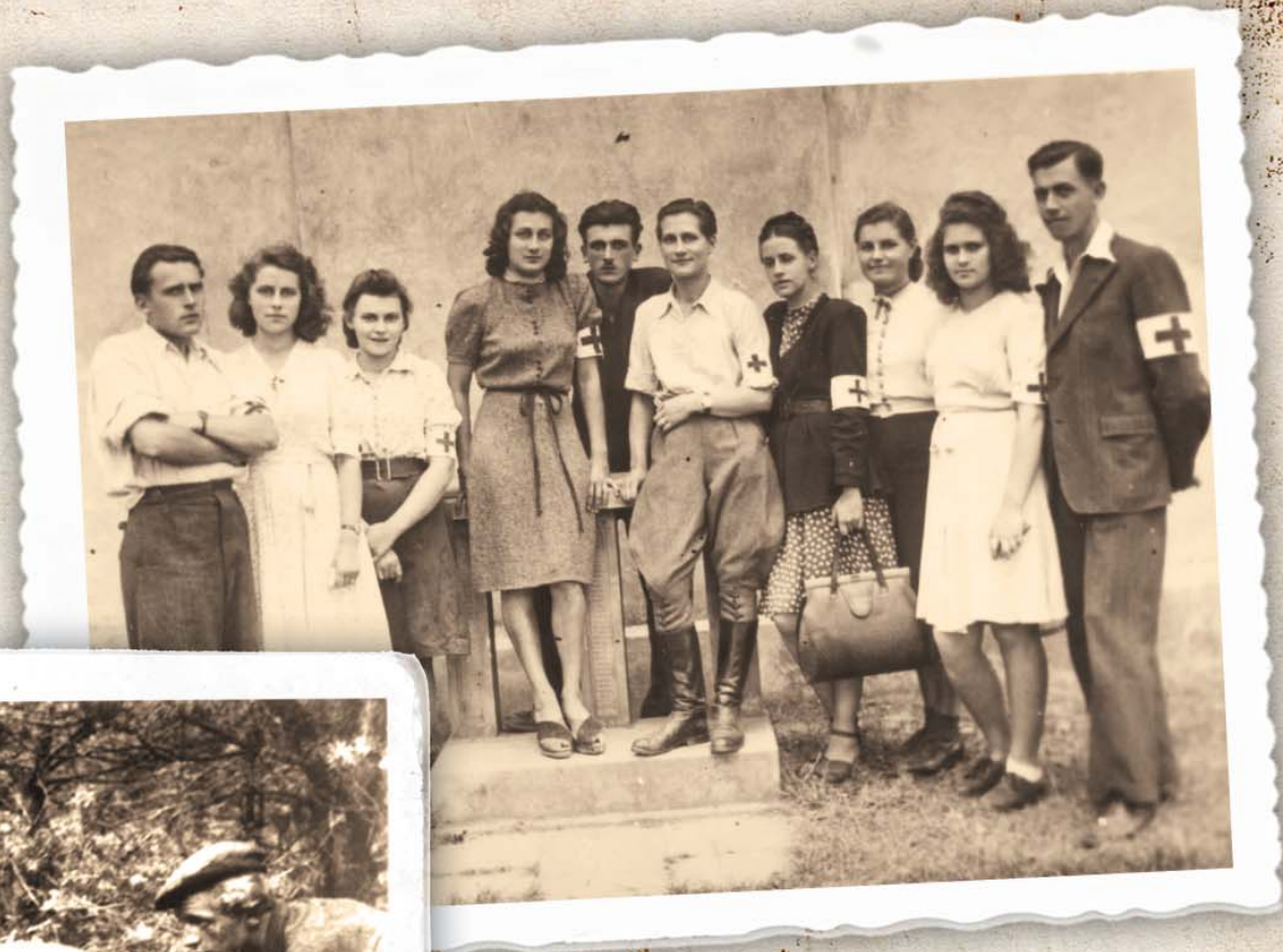
Powyżej: Drużyna sanitarna „Orleń” Obwodu AK Mielec.