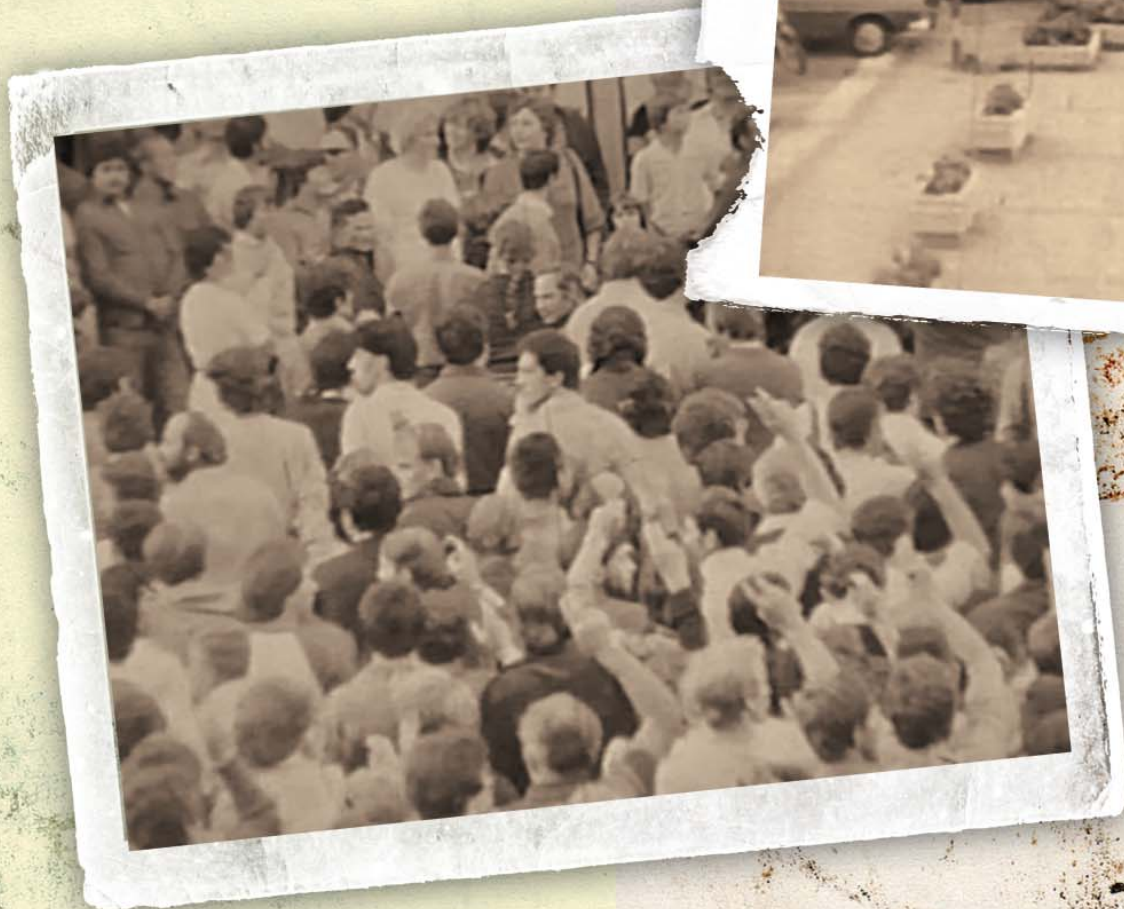
Na zdjęciach: Manifestacja opozycji w Rzeszowie w 1982 r. Kadry z filmu operacyjnego SB.