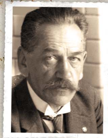
Od lewej: marsz. Józef Piłsudski, gen. Józef Haller, Ignacy Paderewski, Ignacy Daszyński, Roman Dmowski (u góry), Jędrzej Moraczewski (poniżej).