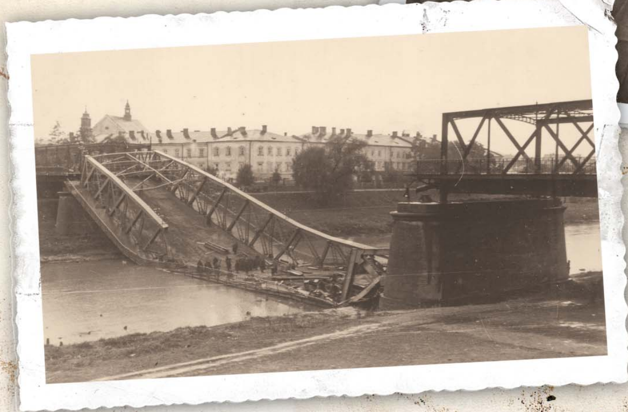
Po lewej: Wysadzony przez polskich saperów most drogowy na Sanie w Przemyślu.