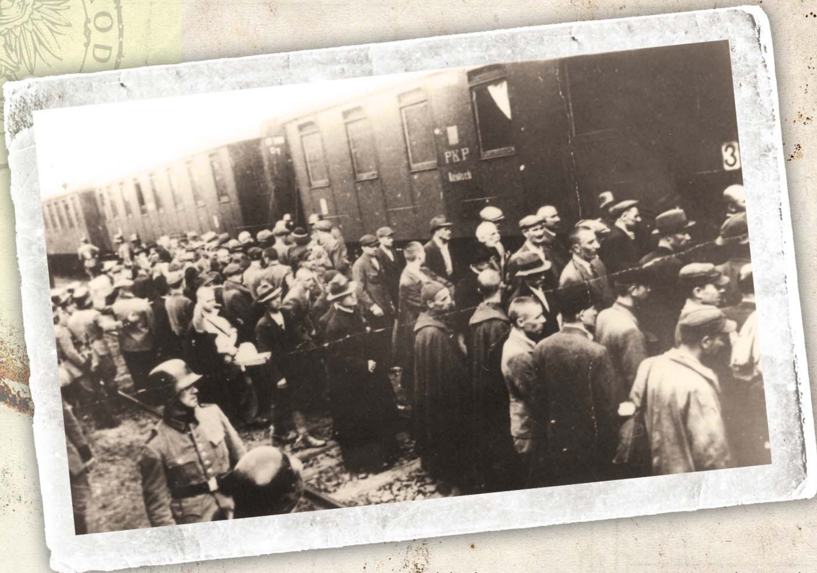
Powyżej: Załadunek pierwszego transportu więźniów z Tarnowa do KL Auschwitz.