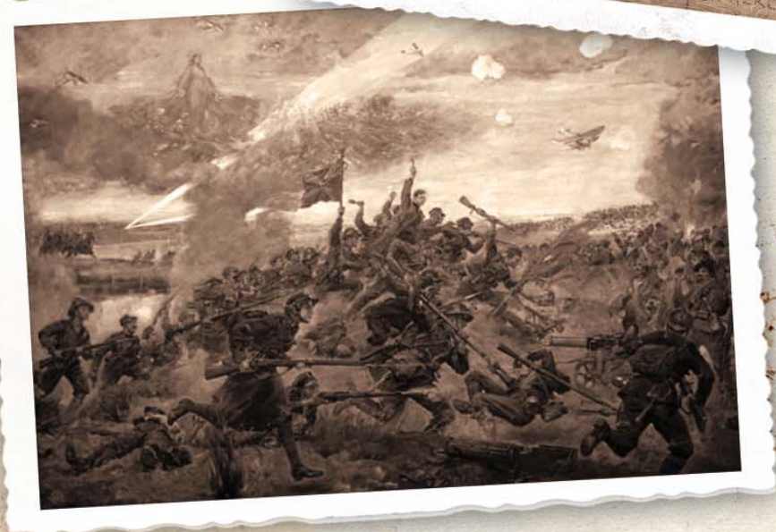
Od lewej: Reprodukacja obrazu „Bitwa Warszawska” Jerzego Kossaka. Jedna z tablic z postulatami robotników strajkujących w stoczni gdańskiej. Powstańczy patrol na warszawskiej ulicy.