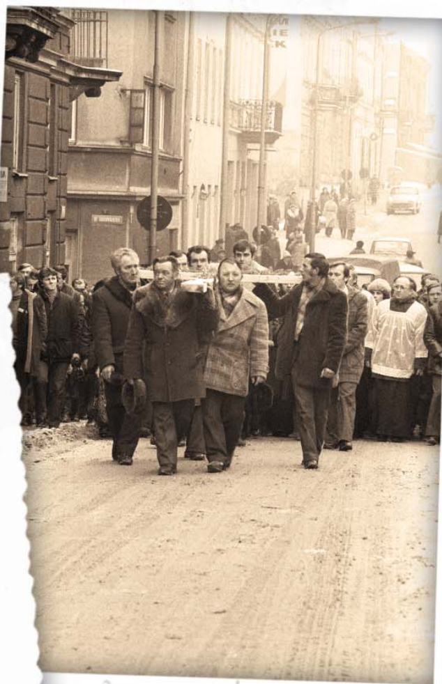
Po lewej: Rzeszów, Plac Zwycięstwa (ob. Ofiar Getta), styczeń–luty 1981 r.