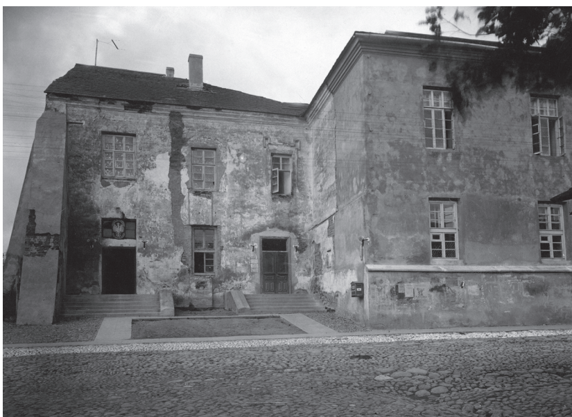
Państwowe Gimnazjum im. Adama Mickiewicza w Nowogródku, 1925–1929