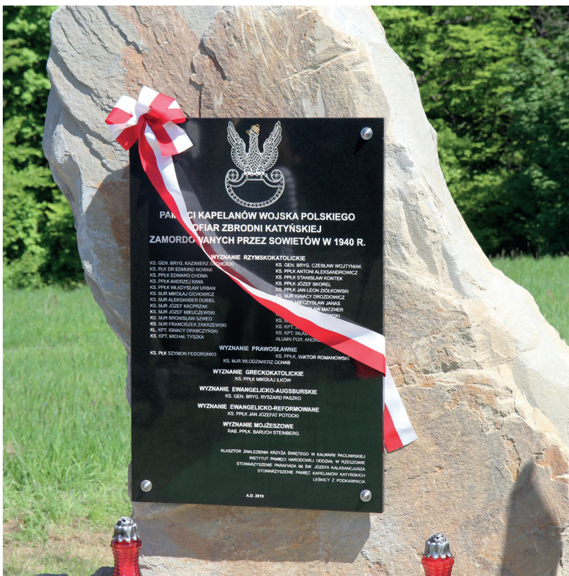
Tablica pamiątkowa ku czci kapłanów pomordowanych przez Sowietów w 1940 r. w zbrodni katyńskiej, odsłonięta 12 maja 2019 r. w Kalwarii Paclawskiej

Losy kapłanów, którzy padli ofiarą zbrodni niemieckich, są na ogół dobrze udokumentowane. Ci zaś, którzy znaleźli się w rękach Sowietów, nadal czekają na wyjaśnienie ostatnich etapów swojej ziemskiej drogi.