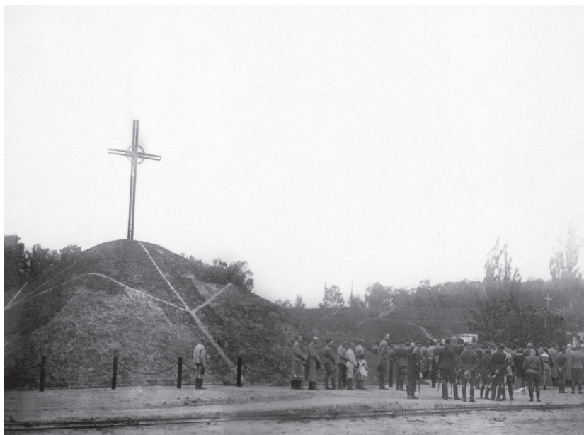
Poświęcenie kopca ku czci poległych żołnierzy I Korpusu Polskiego w Bobrujsku, 1918 r. (NAC)

Starsi uczniowie i uczennice tych organizacji za czasów okupacji niemieckiej i bolszewickiej czynnie współpracowali z wywiadem naszym za pośrednictwem POW. Często zbiórki poufne urządzono w moim mieszkaniu, ja byłem ich ruchowym kierownikiem.