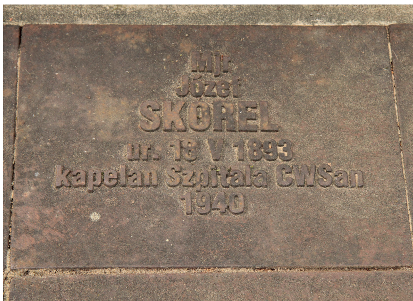
Tablica nagrobna ks. Józefa Skoreła, Miednoje

Został pogrzebany w lesie w Miednoje razem z 12 innymi duchownymi. Są to jedyne informacje na temat jego śmierci.