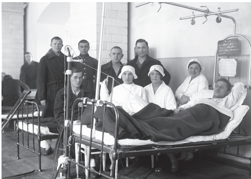
Sala chorych w 1 Szpitalu Okręgowym im. Marszałka Piłsudskiego, 1932–1933 r.

Jest to ciekawe, ponieważ pełniąc posługę w szpitalu wojskowym w Warszawie, ks. Skorel udzielał ostatniego namaszczenia ważnym postaciom życia publicznego w II Rzeczypospolitej. 15 czerwca 1934 r. rozgrzeszał umierającego ministra spraw wewnętrznych Bronisława Pierackiego, śmiertelnie postrzelonego przez ukraińskiego zamachowca na ul. Foksal. Ówczesna prasa donosiła: