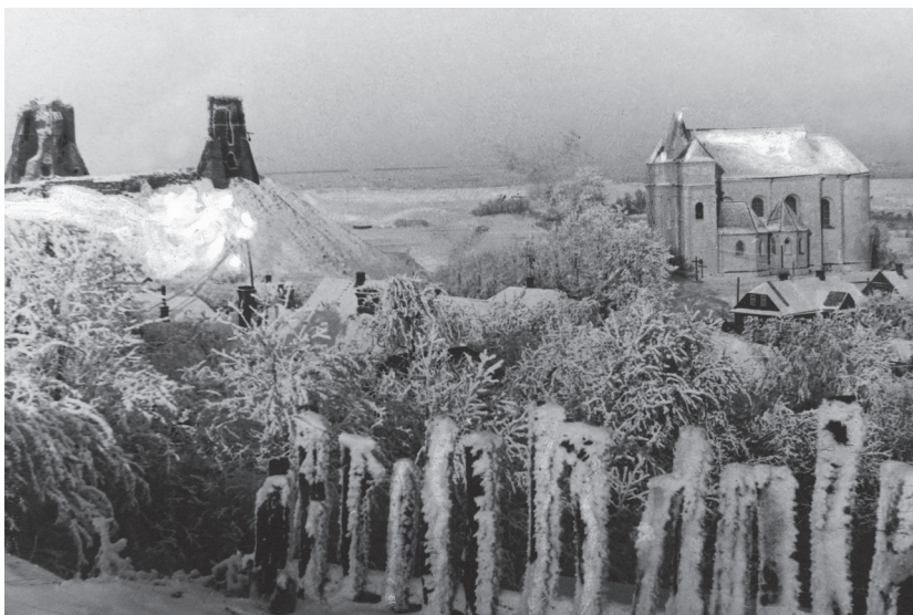
Nowogródek zimą. W tle po prawej kościół pw. Przemienienia Pańskiego, po lewej ruiny zamku książąt litewskich na Górze Zamkowej, dwudziestolecie międzywojenne