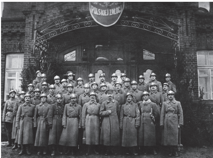
Oficerowie 1 Pułku Inżynieryjnego z I Korpusu Polskiego przed jednym z budynków twierdzy Bobrujsk, 1918 r.