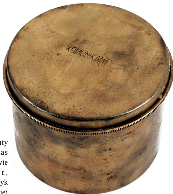
Puszka na komunikanty odnaleziona podczas ekshumacji w Charkowie w 1996 r.