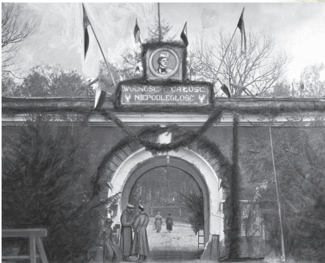
Brama wiodąca do twierdzy Bobrujsk udekorowana z okazji święta 3 Maja, 1918 r.

Księżda Skorela oskarżono o współudział w przechowywaniu broni i amunicji otrzymanej z I Korpusu Polskiego, służącej do prowadzenia akcji dywersyjnych na tyłach bolszewickich. Przesłuchał go osobiście Feliks Dzierżyński, stojący na czele nowo utworzonej Wszechrosyjskiej Nadzwyczajnej Komisji do Walki z Kontrrewolucją i Sabotażem. Po trzech tygodniach pobytu w areszcie został zwolniony, jednak nadal był obserwowany i nie mógł opuszczać Bobrujska. W tajemnicy przed władzami bolszewickimi udało mu się jednak przedostać do Polski, gdzie zaraz się zgłosił do służby w powstającym Wojsku Polskim.