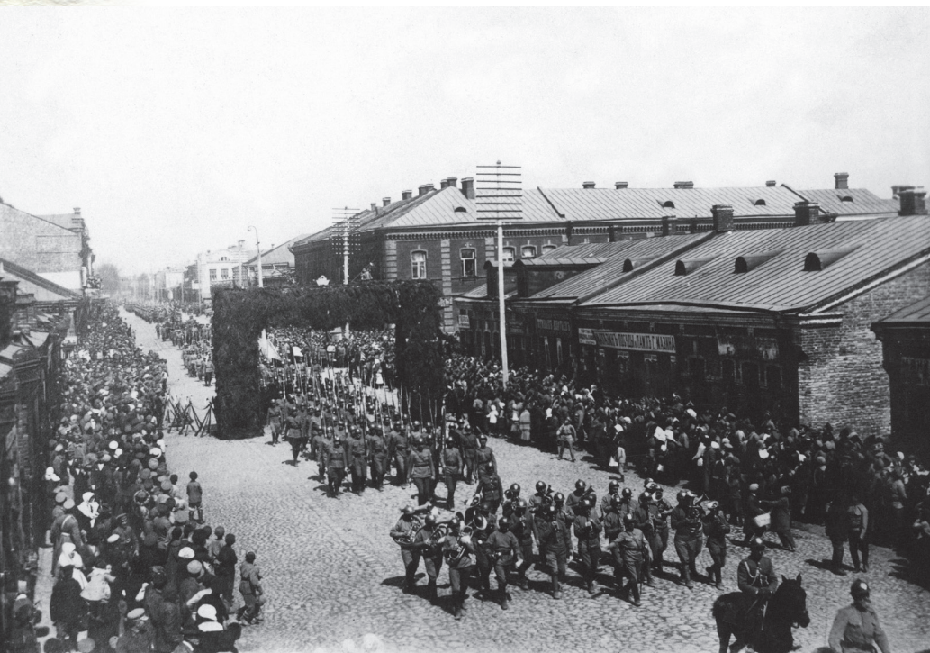
Defilada wojskowa z okazji święta 3 Maja w Bobrujsku z udziałem I Korpusu Polskiego, 1918 r.